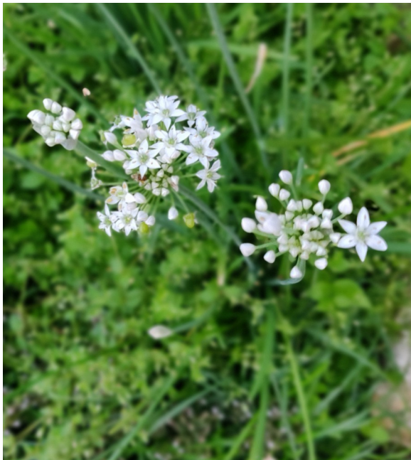
Foto: Paul R. Stadelhofer / CC BY-SA 3.0 http://creativecommons.org/licenses/by-sa/3.0/

http://creativecommons.org/licenses/by-sa/3.0/