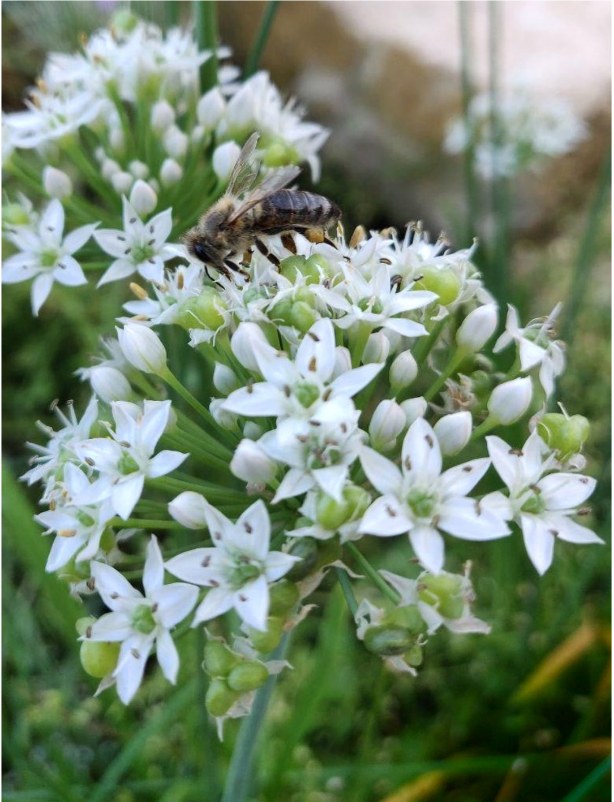
Schnittknoblauch ( Allium tuberosum )