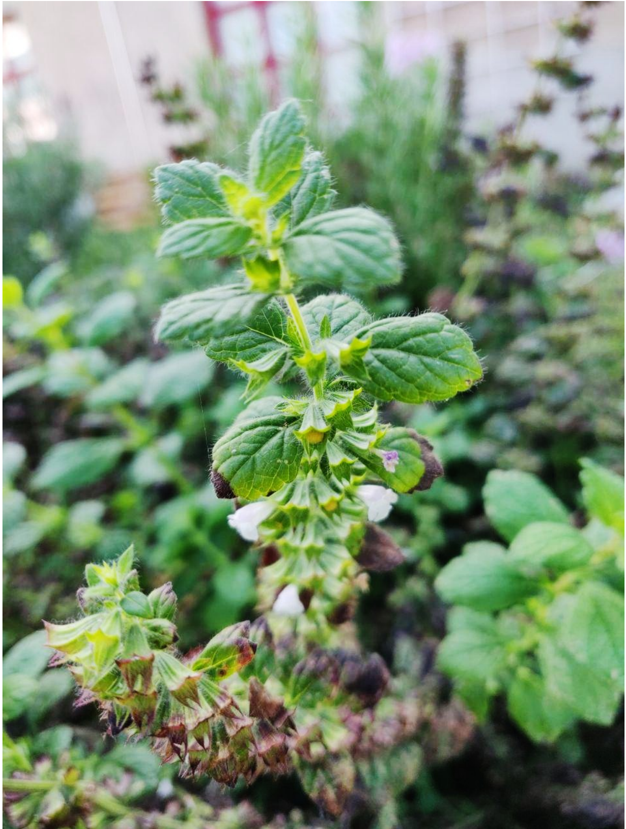
Zitronenmelisse ( Melissa officinalis )