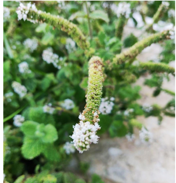
Foto: Mentha x villosa / Paul R. Stadelhofer / CC BY-SA 3.0 http://creativecommons.org/licenses/by-sa/3.0/

Ernte: Laub / Blüten bei Blühbeginn / nach Blüte als Tee, Arznei, Gewürz