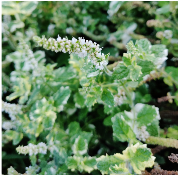
Bild: Mentha suaveolens 'Variegata' / Paul R. Stadelhofer / CC BY-SA 3.0 http://creativecommons.org/licenses/by-sa/3.0/