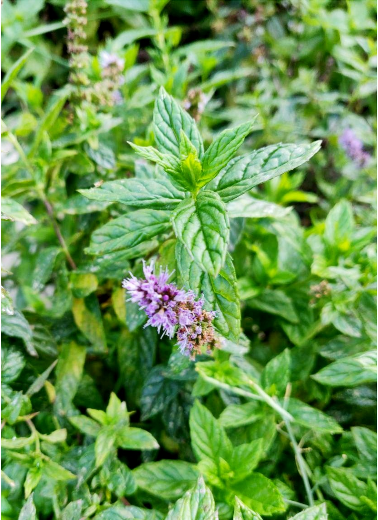
Minzen ( Mentha spp.)