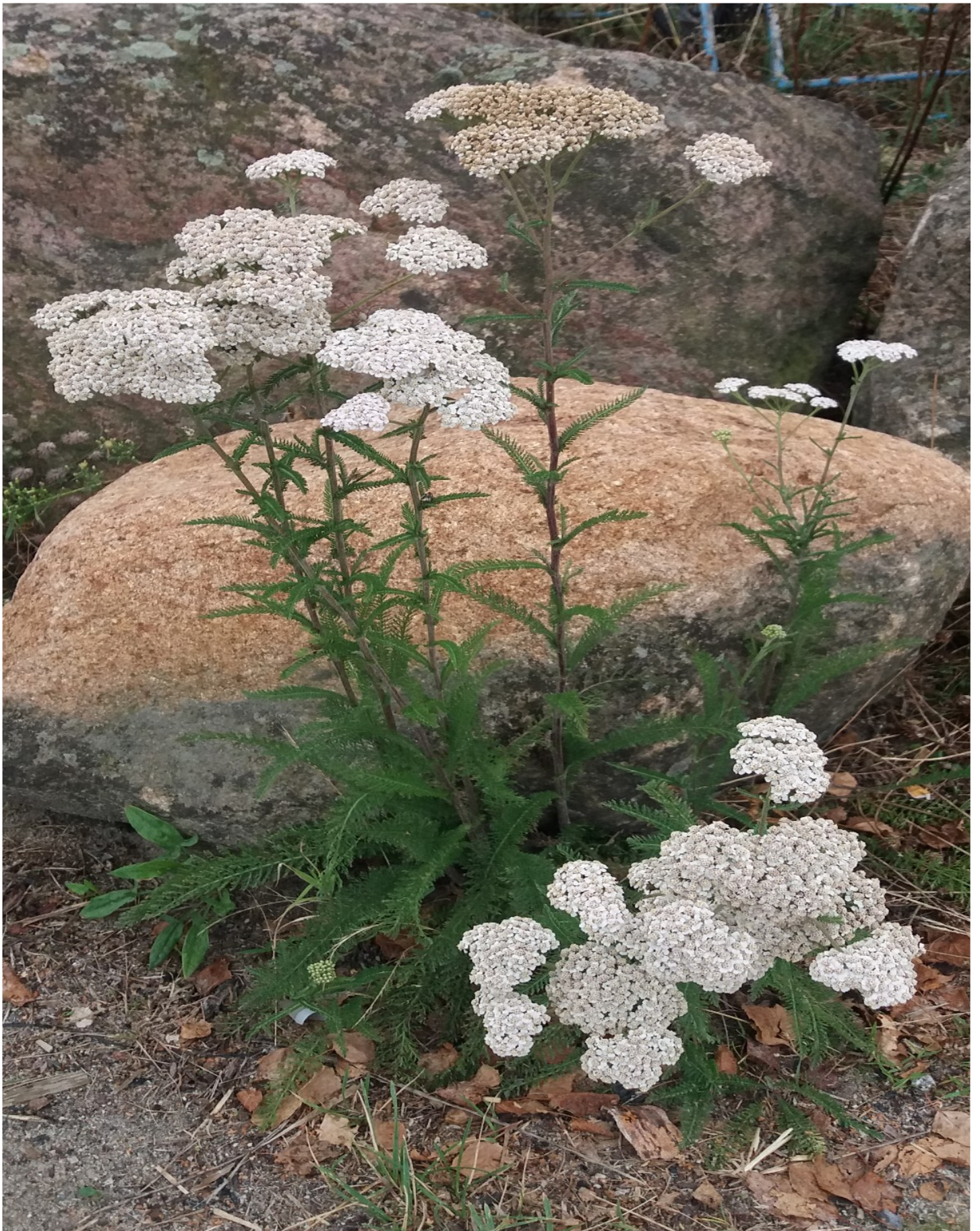
Wiesen-Schafgarbe ( Achillea millefolium )