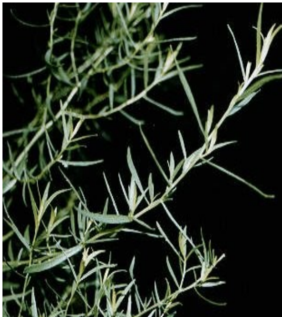
Foto: Estragon, gemeinfreies Bild

http://creativecommons.org/licenses/by-sa/3.0/