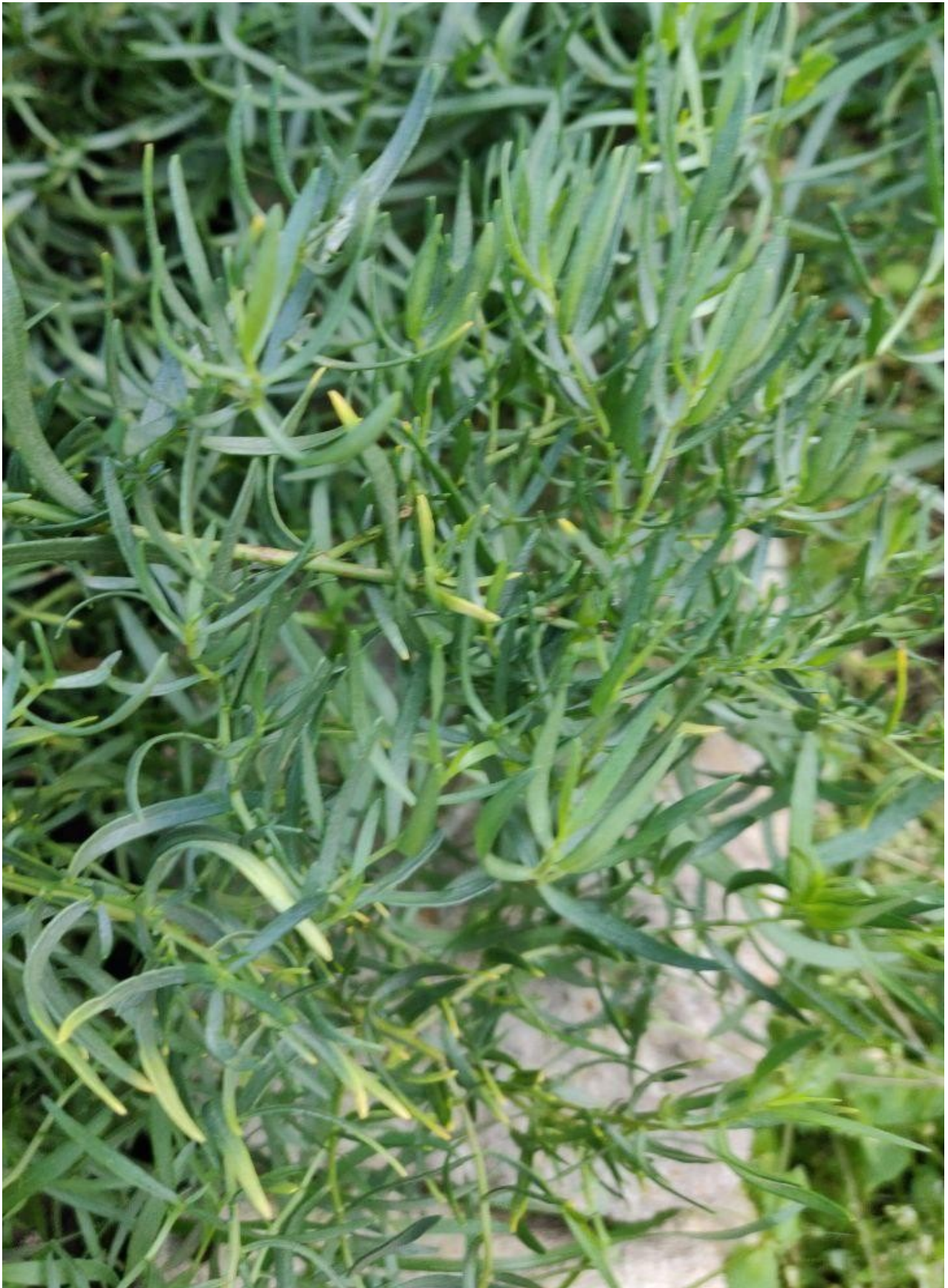
Eragrostis ( Artemisia dracunculus )