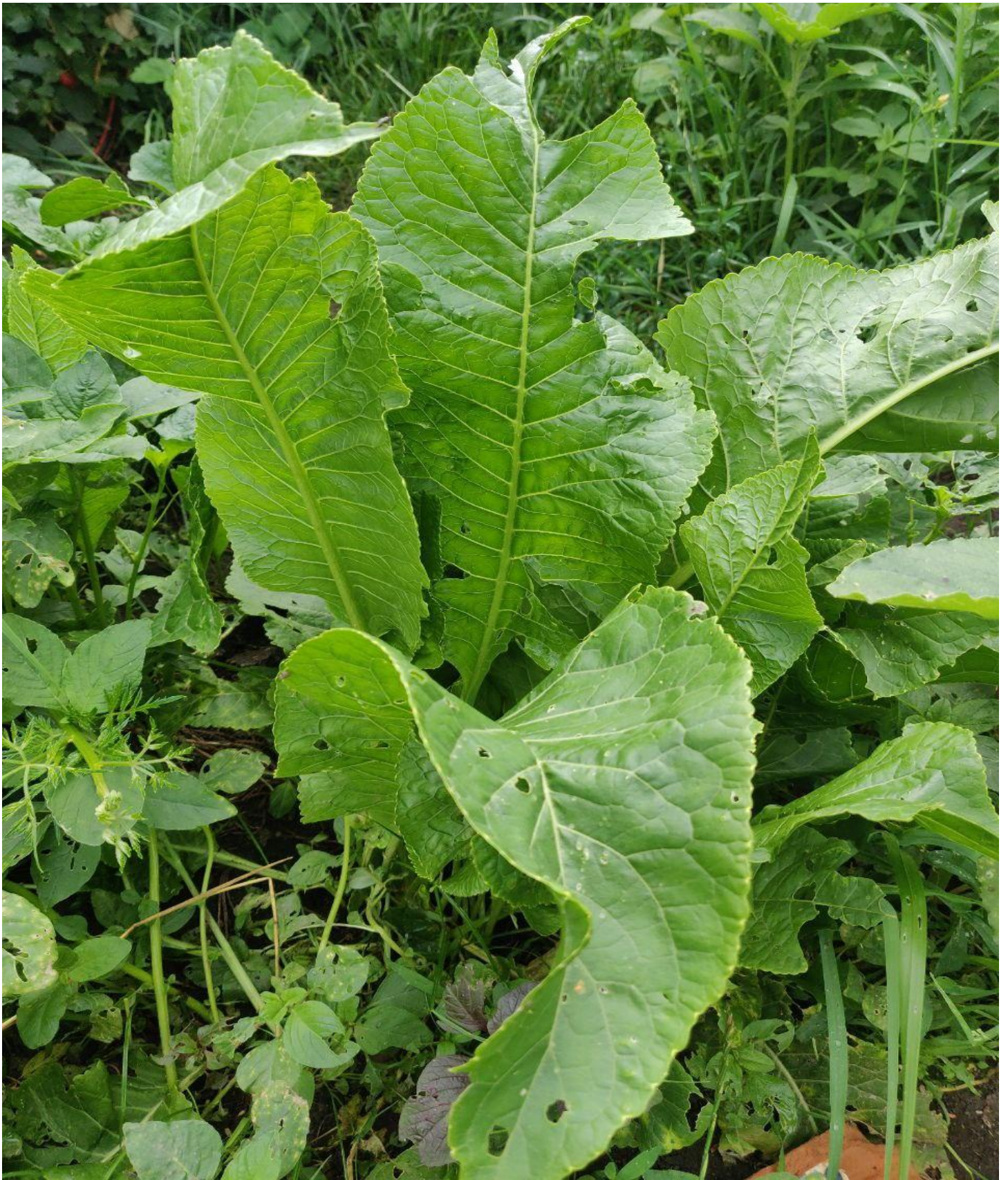
Meerrettich ( Armoracia rusticana )